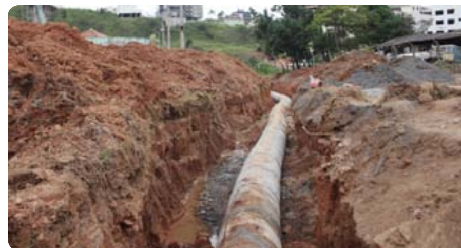
Obra será concluída em 20 dias

A Prefeitura trabalha na recuperação de mais de 100 metros de rede pluvial na avenida Castelo Branco, no final do bairro República. A obra se tornou necessária depois que a rede afundou. Segundo a Secretária de Obras, o serviço, realizado com mão de obra própria, tomou uma pro-