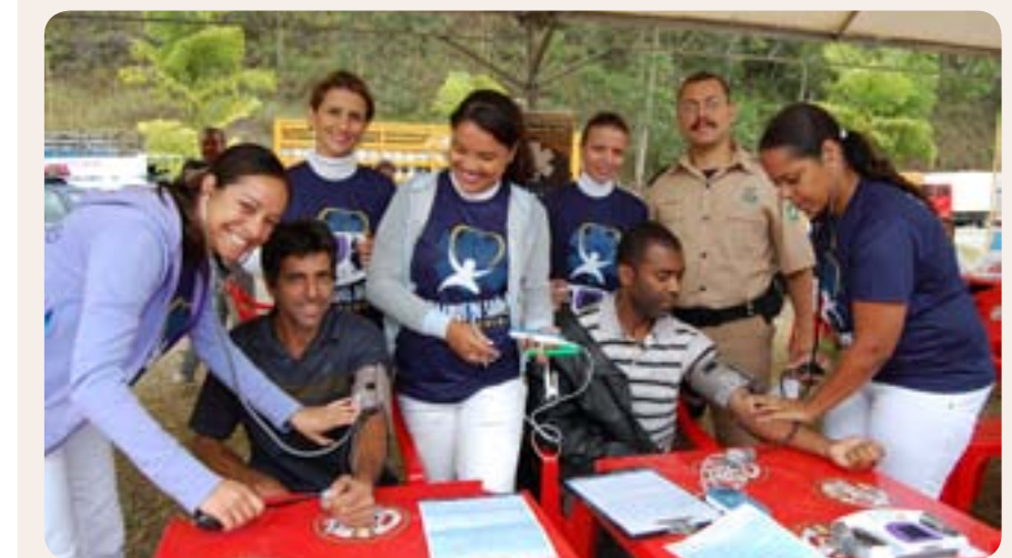
Evento contou com profissionais da Saúde da Prefeitura

de Massa Corporal (IMC), além da realização de exames de vista, audição e força manual. A Prefeitura também disponibilizou profissionais de saúde para avaliar os motoristas, que ainda tiveram corte de cabelo gratuito e participaram de um café da manhã. O evento teve a parceria da escola Centro Educacional Roberto Porto, Sevor, Sest/Senat e do Consórcio Intermunicipal de Saúde Médio Piracicaba (Cismepi).