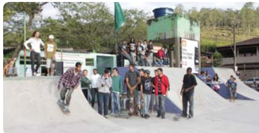
New Life teve provas de skate, bicicleta e patins

O 1º New Life, promovido pela Associação de Esportes Radicais de João Monlevade e pela Igreja Cristã Apostólica, reuniu competidores para disputas de BMX (bicicleta), skate e patins inline nas quadras esportivas do bairro Baú, nos dias 19 e 20 de maio. Foram distribuídos prêmios para os três primeiros coloca-