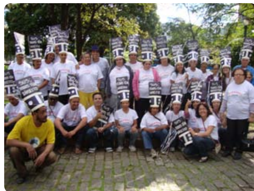
Usuários pedem melhor atendimento do SUS

Com apoio da Prefeitura de Monlevade, a Associação dos Usuários da Saúde Mental de João Monlevade (Assume) participou das comemorações do dia Nacional da Luta Antimanicomial, comemorado no dia 18, em Belo Horizonte. A manifestação saiu da Praça da Liberdade e tomou as avenidas da capital mineira.