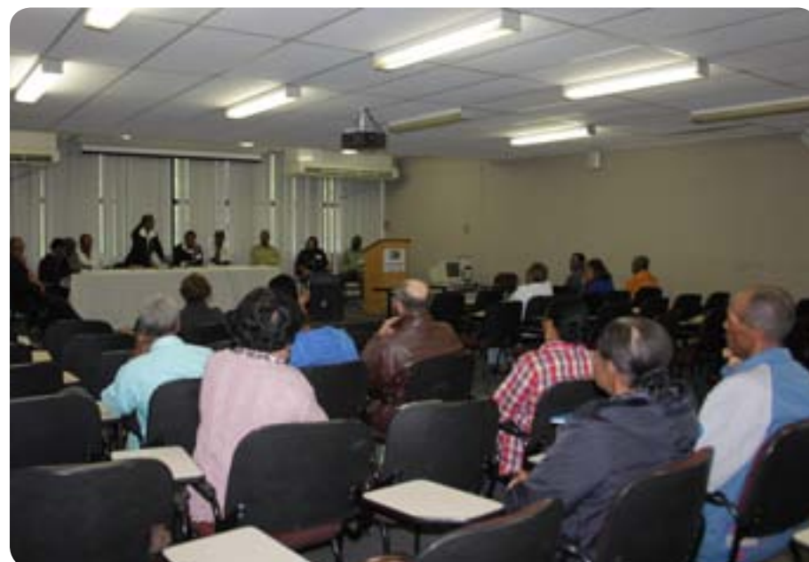
Representantes das guardas de Congado se reúnem uma vez por mês

de Congado. “Tenho muito a agradecer à Prefeitura, que sempre nos apoiou. O tombamento da guarda de Nossa Senhora do Rosário foi muito importante para manter a nossa tradição”, avaliou. O reconhecimento das guardas Nossa Senhora de Santana e São João Evangelista como bens culturais imateriais do município estão em processo de conclusão.