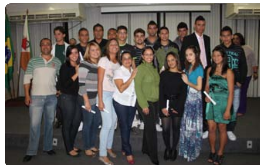
Curso foi promovido pela Fundação Crê-Ser em parceria com o Senai

A Fundação Crê-Ser, em parceria com o Serviço Nacional de Aprendizagem Industrial (Senai), entregou, no dia 18, no auditório Leonardo Diniz (sede da Prefeitura), certificados do curso de qualificação profissional em Auxiliar Administrativo. As aulas foram ministradas nas dependências do Senai, durante três meses, e contou com a participação de 17 alunos. Um dos formandos que rece-