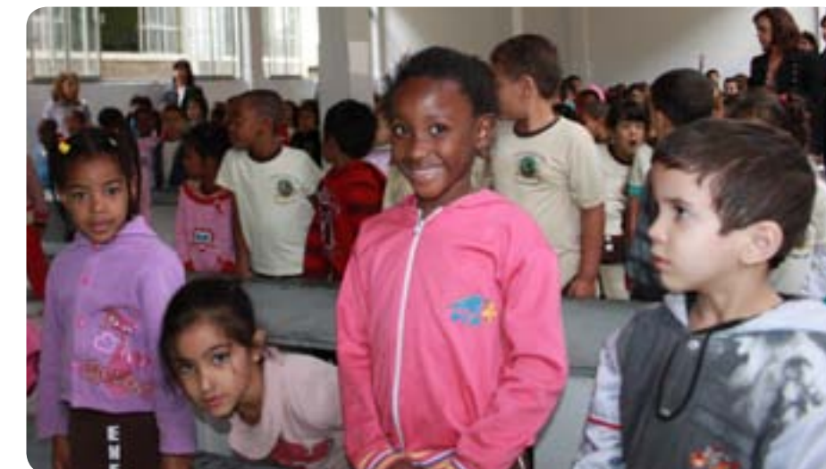
Crianças entre 4 e 5 anos são beneficiadas com a obra

os alunos tinham que ir para as salas de aula com a merenda devido à falta de um espaço adequado para fazer as refeições”, conta a educadora. A escola Efigênio Motta atende, aproximadamente, 400 crianças com idade entre 4 e 5 anos. Em breve, outros dois centros de Educação Infantil serão construídos no bairro José Alencar e no Loanda.